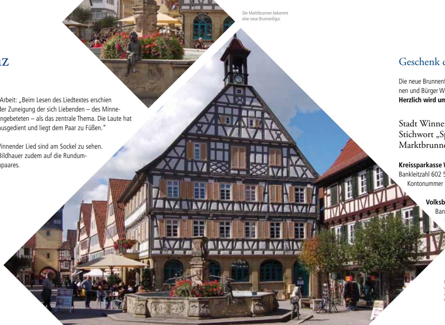
Der Marktbrunnen bekommt eine neue Brunnenfigur.

Auszüge aus dem Winnender Lied sind am Sockel zu sehen. Viel Wert legte der Bildhauer zudem auf die Rundumwirkung des Figurenpaares.