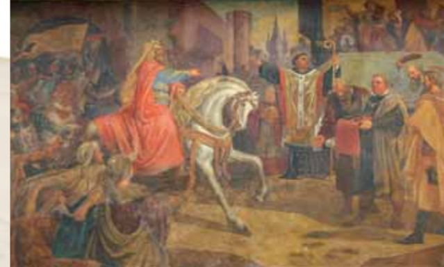
Einzug des Stauferkönigs Friedrich II. in Konstanz 1212.

Seine eigentliche Bedeutung erreichte Heinrich d. Ä. von Neuffen jedoch in den 1220er und 1230er Jahren in Deutschland. Zum Kreis der Berater des Erzbischofs Engelbert von Köln, der in Abwesenheit Friedrichs II. die Macht in Deutschland ausüben sollte, und als Erzieher von Friedrichs unmündigem, 1212 geborenem Sohn Heinrich (VII.) gehörte neben einigen anderen