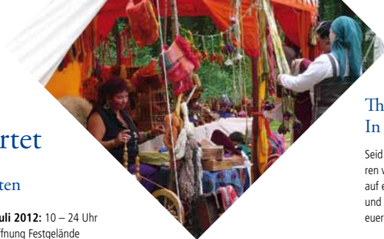
Händler verkaufen spezielle Waren aller Art.

Sonntag, 8. Juli 2012: 10 – 18 Uhr 10.00 Uhr – Ökumenischer Gottesdienst in der Schlosskirche 11.00 Uhr – Öffnung Festgelände 18.00 Uhr – Beendigung des Markttreibens