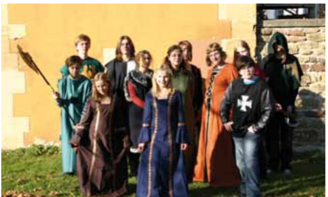
Mitwirkende der Musical-AG des Lessing-Gymnasiums Winnenden.

Im Sommer 2006 wurde das Mittelalter-Musical „Vogelfrei“ (ur-)aufgeführt. Nun heißt es anlässlich der 800-Jahr-Feier „Vogelfrei reloaded“! In der Neufassung natürlich mit Gottfried von Neuffen, Berufung: Minnesänger!