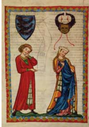
Die berühmte Liederhandschrift „Codex Manesse“ zeigt „Herrn Gottfried von Neiffen“ als Minnesänger.

Das Bemerkenswerte am gesamten Lied ist, dass es Gottfried trotz des auf die Spitze getriebenen Reimspiels gelingt, witzige und geistreiche Passagen einzubringen. Und um die versteckten Anspielungen verstehen zu können, musste man schon sehr gebildet sein. Wer solche Gedichte kapierte und im rechten Moment schmunzelte oder loslachte – der gehörte „zur Gesellschaft“.