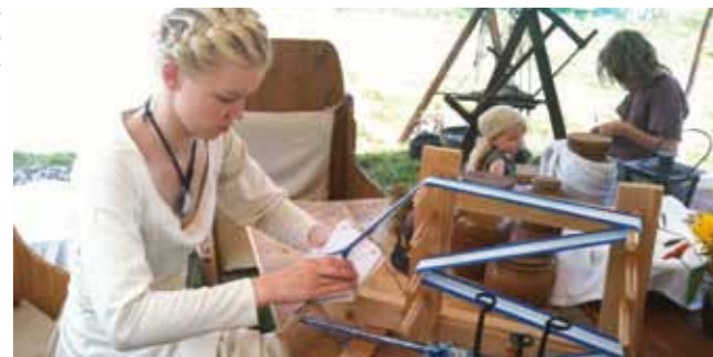
Das Winnender Mädchen war eine Garnspinnerin.

Doch wer war dieses Mädchen, das im Jubiläumsjahr eine ganz besondere Rolle spielt? Sicher wissen wir, dass sie dem Minnesänger Gottfried von Neuffen gehörig „den Kopf verdreht“ hat. In seinem „Winnender Lied“ erzählt er in kunstvollen Reimen, wie er die Winnenderin kennenlernt und sich beide ineinander verlieben.