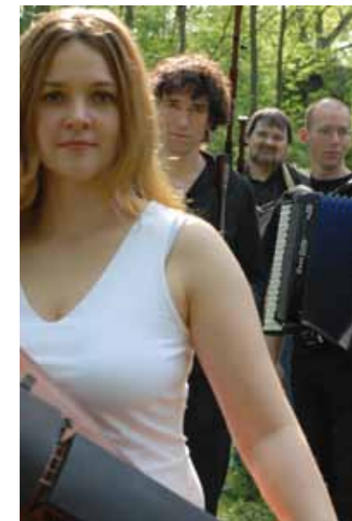
Folkgruppe „La Marmotte“

Der Eintritt ist frei, die Anzahl an Plätzen jedoch begrenzt.