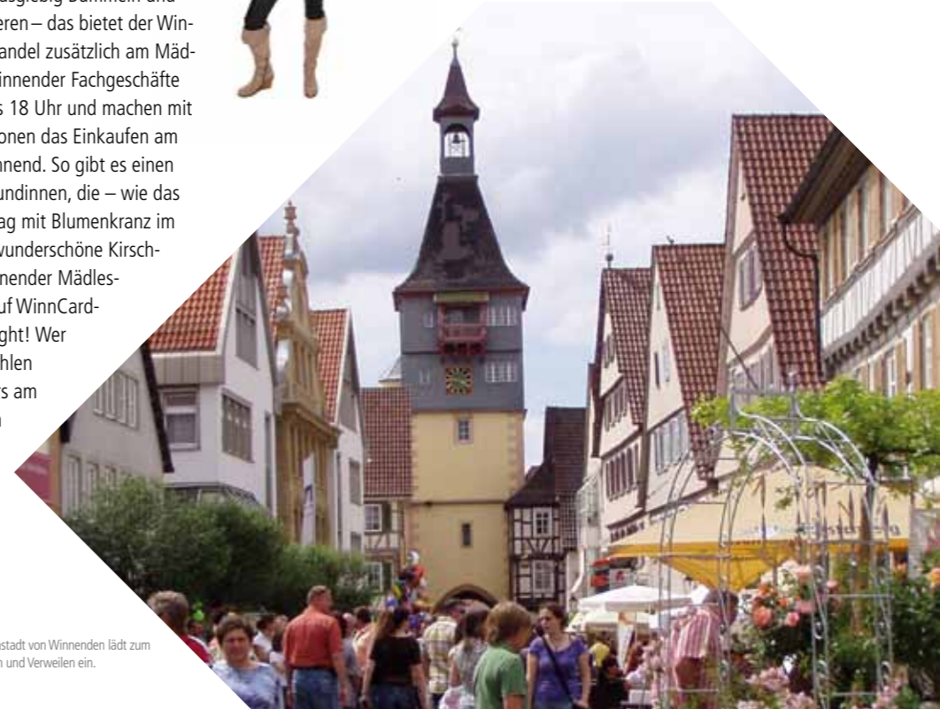
Die Innenstadt von Winnenden lädt zum Einkauf und Verweilen ein.