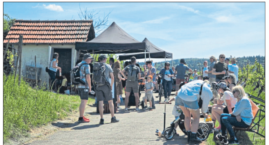
Weinwanderung bei strahlendem Himmel.