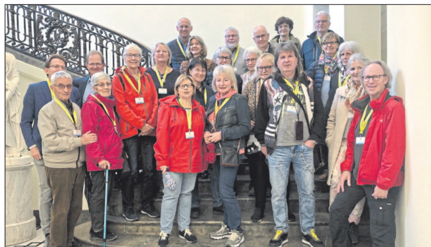
Die VHS-Gruppe in der Villa Reitzenstein.

24 VHS-Kursteilnehmende im Amtssitz des Ministerpräsidenten