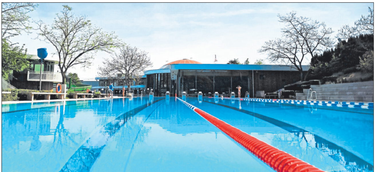
Sportbecken im Wunnebad.