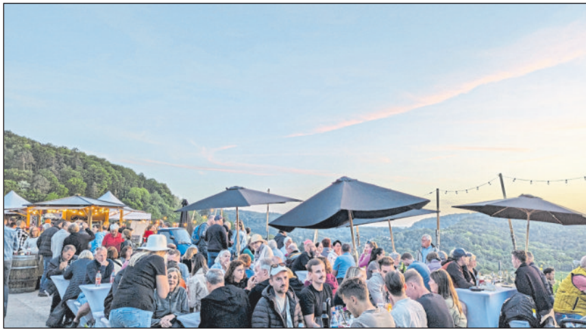
Sommerliche Temperaturen auf der Panoramafestmeile.

Bereits am Samstagnachmittag füllte sich die Festmeile zwischen dem Haselstein und Roßberg. An den gemütlich angeordneten Sitzgelegenheiten machten es sich die Weinfreunde dann zum Sonnenuntergang bequem und verweilten noch lange, nachdem die letzten warmen Sonnenstrahlen am Horizont verschwunden waren. Stets versorgt mit edlen Tropfen von den Weingütern Luckert,