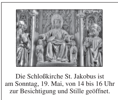
Die Schloßkirche St. Jakobus ist am Sonntag, 19. Mai, von 14 bis 16 Uhr zur Besichtigung und Stille geöffnet.