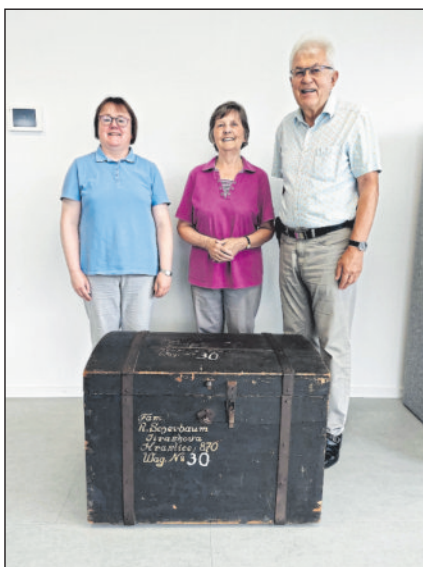
Offizielle Übergabe einer Fluchtkiste aus dem Besitz der Familie Scherbaum an das Stadtarchiv Winnenden am 24. Juli 2024.

Der Film kann künftig ebenfalls auf der Internetseite www.virtuelles-stadtmuseum-winnenden.de angeschaut werden. Er ist eingebunden in die „Geschichte einer Fluchtkiste“ im Themenraum „Bevölkerung“. Direkt erreichbar sind die beiden neuen Beiträge über Zugangslinks auf der Startseite.