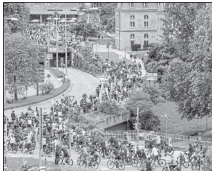
2025 Ankunft am Schlossplatz

Unsere Vision: Null Verkehrstote - volle Lebensqualität