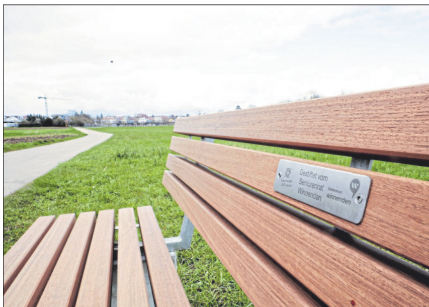
Die vom Seniorenrat gestiftete Bank am Verbindungsweg zwischen Winnenden und der Ruitzenmühle.

Noch vor wenigen Tagen wurde am Verbindungsweg zwischen der Ruitzenmühle und dem Kinderhaus Seewasen zum Tag des Baumes eine Silberlinde gepflanzt. Nur kurz darauf stiftete der Seniorenrat Winnenden eine Bank für dieselbe Stelle.