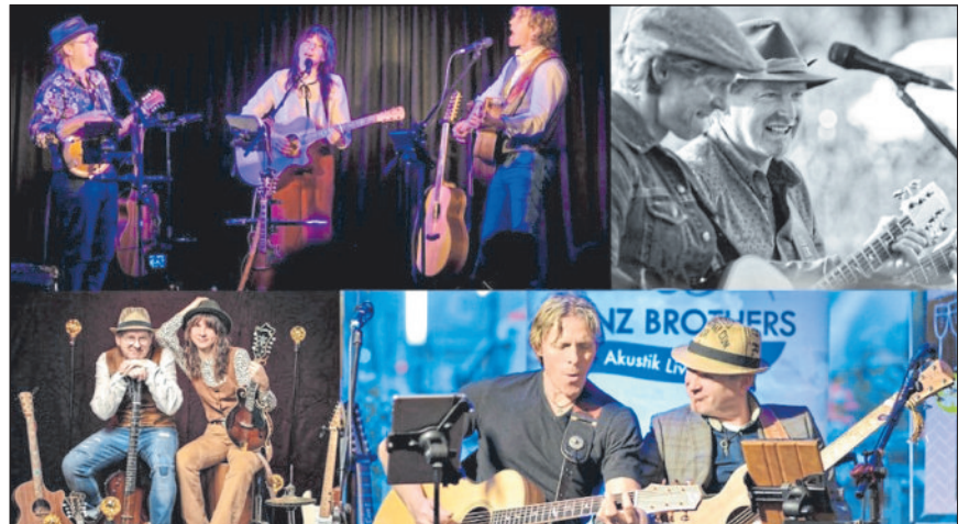
Die Birds Band - Drimagisches Konzert.

am Freitag, 12.09.2025, um 18.30 Uhr mit Die Birds Band, Rusty Rose und das Duo Lenz Brothers, ein drimagisches Konzert