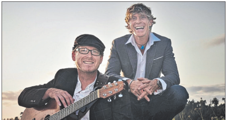
Duo Lenz Brothers.

Beim Kunsttreff am Marktbrunnen tritt am Freitag, 12. September, um 18.30 Uhr die „Die Birds Band“ auf. Zwei Musiker, 12 Instrumente, die Birds klingen einfach nach MEHR als nur nach einem Akustik-Duo. Ihre Lieder erzählen persönliche Geschichten, von Zuhause und von der Liebe, von Umwelt und Natur, von Fernweh und Freiheit, von Selbstbestimmung und Feminismus und davon, sich selbst zu finden.