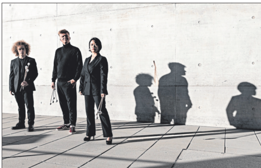
Gang Ta Trio.