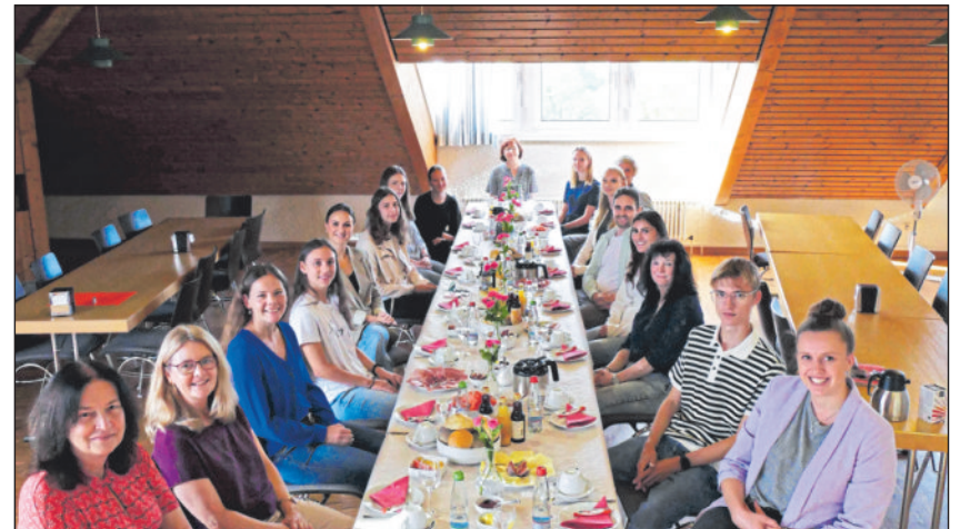
Auszubildende und ihre Ansprechpartnerinnen und -partner beim Azubi-Frühstück.

Beim Ausbildungsfrühstück lernen die zwei Auszubildenden und drei Einführungspraktikanten, welche am 1. September bei der Stadt Winnenden begonnen haben, die Ausbildungsbeauftragten der jeweiligen Bereiche kennen.