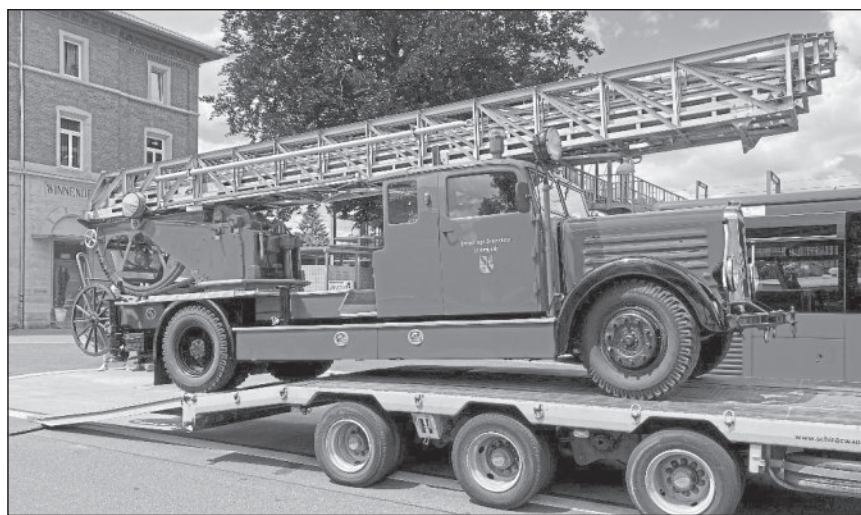
Die Kraftfahrdrehleiter wird vor dem Feuerwehremuseum in Winnenden abgeladen.

- Technisches Kulturgut bereichert feuerwehrhistorische Sammlung