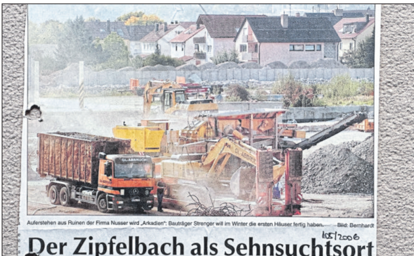
Auferstehen aus Ruinen der Firma Nusser wird „Arkadien“: Bauträger Strenger will im Winter die ersten Häuser fertig haben. Der Zipfelbach als Sehnsuchtsort