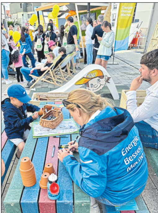
Beim Süwag-Energiepark in Winnenden.