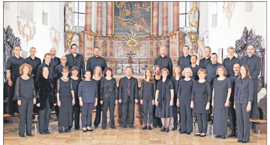
Kammerchor „camerata nova“