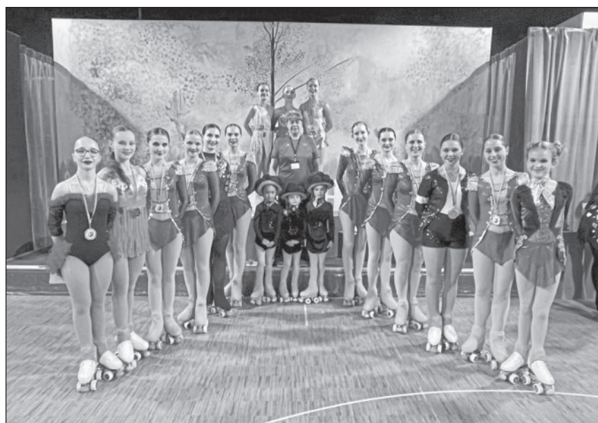
Formation Sparkling Wheels.

Tageseltern Winnenden und Umgebung e.V., Tel.: 07195-13469-73, -74, -75, info@tageseltern-winnenden.de, www.tageseltern-winnenden.de