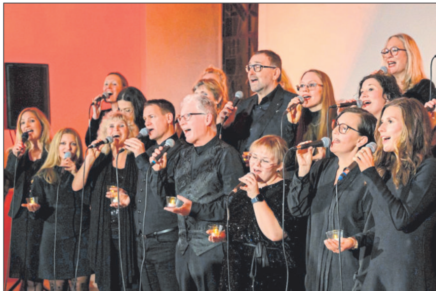
Archivbild: The Gospel House

Mit „Musik in Heimen“ haben das Amt für Soziales, Senioren und Integration sowie das Amt für Schulen, Kultur und Sport in Winnenden eine Veranstaltungsreihe wieder aufleben lassen, die Menschen in Alters- und Pflegeheimen an der städtischen Kultur teilhaben lässt.