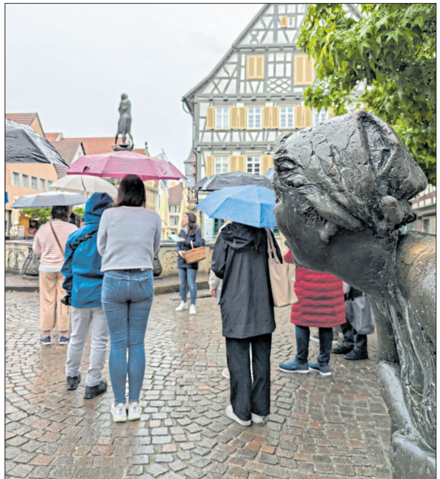
Die Stadtführung führte auch am Marktbrunnen und den Figuren am Marktplatz vorbei.

Am 5. Mai, dem Europäischen Protesttag zur Gleichstellung von Menschen mit Behinderung, hat in Winnenden erstmals eine inklusive Stadtführung stattgefunden. Mit diesem neuen Angebot möchte die Stadt besonders Menschen mit körperlichen, sensorischen oder kognitiven Einschränkungen die Möglichkeit geben, die Stadtgeschichte vor Ort und ohne Barrieren zu erleben.