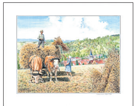
Ernte vor Birkmannsweiler, gemalt von Erwin Hertle im August 1956. Privatsammlung Hertle

Wer mehr über Erwin Hertle erfahren oder sich das Zeitzeugeninterview ansehen möchte, kann das ab heute im Virtuellen Stadtmuseum Winnenden tun. Dort wurde das Video im Rahmen einer Biographie über diesen interessanten Menschen eingestellt. Beides ist zugänglich im Themenraum „Die Stadtteile“ unter Birkmannsweiler oder direkt über diesen Link: https://www.virtuelles-stadtmuseum-winnenden.de/thema/biographie/hertle-erwin .