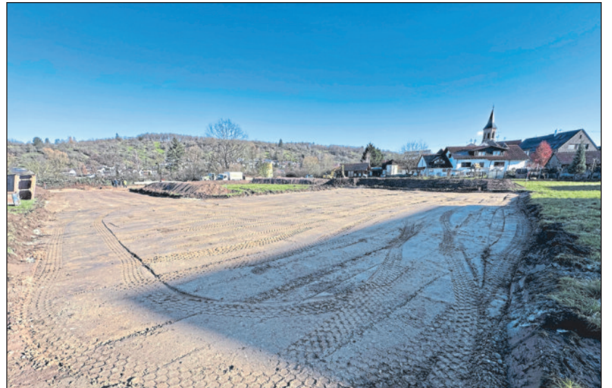
Das Erschließungsgebiet in den Kreuzwiesen.