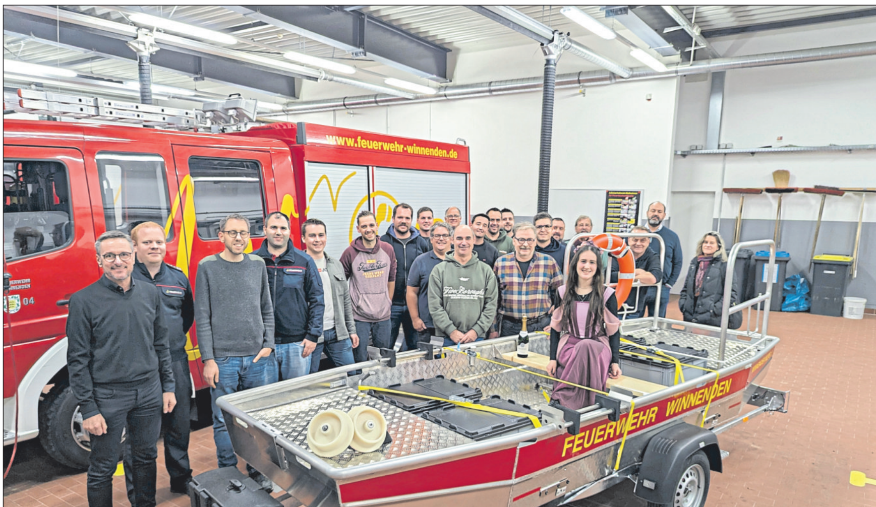
Vorstellung des Einsatzboots bei der Gesamtausschusssitzung der Freiwilligen Feuerwehr.