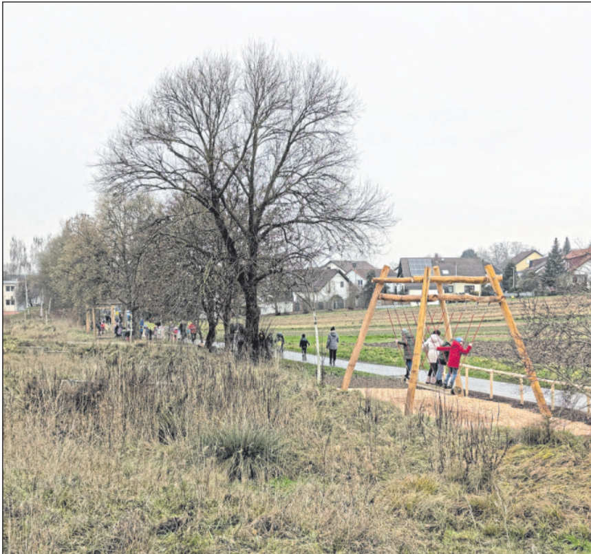
Die Spielgeräte am Wegesrand wurden bei der Einweihung durch Kindergarten- und Grundschulkinder umgehend ausprobiert.

Das Neubaugebiet Adelsbach bietet mit dem Kindergarten und der nahegelegenen Grundschule Hungerberg einen attraktiven Wohnort für junge Familien. Mit den neuen öffentlichen Spielgeräten am Rothbachgraben verfügt das Gebiet nun auch über eine attraktive öffentliche Spielfläche.