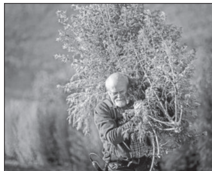
Artemisia Anbau ist eine harte Arbeit.

Der Ort ist das ev. Gemeindehaus im Schelmenholz. Raumöffnung ist jeweils 13.30 Uhr, Beginn jeweils 14 Uhr. Die Teilnahme kostet 20 Euro zugunsten des Unterhalts des Gemeindehauses. Die Platzzahl ist begrenzt. Um eine Überbuchung mitteilen zu können, ist eine Anmeldung jeweils 2 Wochen vor Beginn zwingend notwendig bei info@anamed.org oder per Post mit Rückporto an anamed Verein, Paulinenstraße 23, 71364 Winnenden. Nähere Informationen zum Programm bzw. über noch offene Plätze finden sich unter der Homepage anamed.org oder im Schaufenster des Vereins. Eine Teilnahme ohne Anmeldung ist nicht möglich.