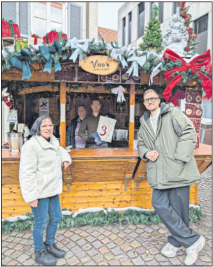
3. Platz: Vitos Weihnachtshütte - der neue Inhaber des Milchhäusles am Marktplatz.

Ein herzlicher Dank gilt allen Standbetreibern, Händlern, Gastronomen, Vereinen und Beteiligten für ihr großes Engagement und einen rundum gelungenen Winnender Weihnachtsmarkt 2025.