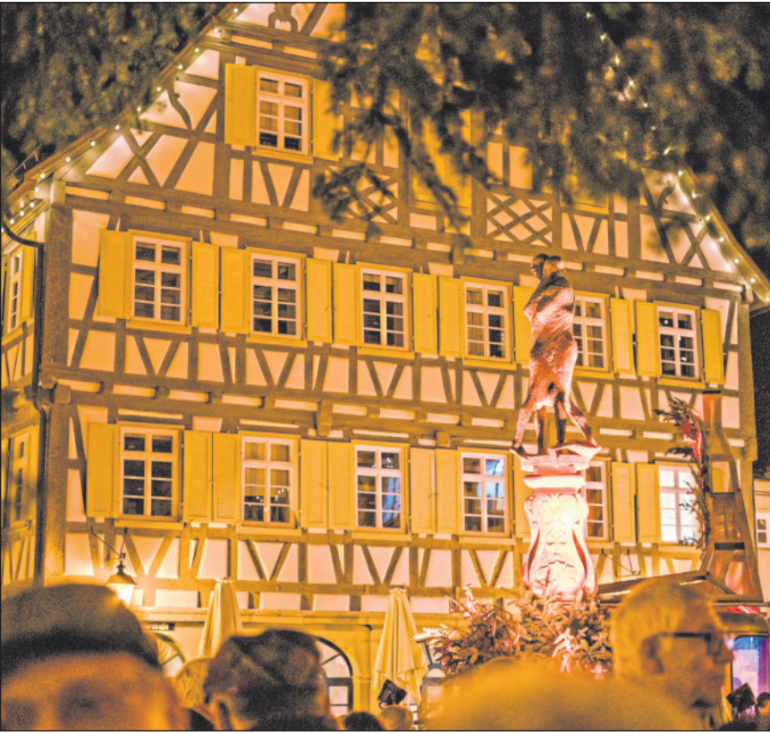
Weihnachtliche Stimmung rund um dem Marktbrunnen.