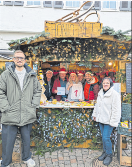
1. Platz: Bienenzuchtverein - für eine besonders liebevolle und kreative Dekoration.