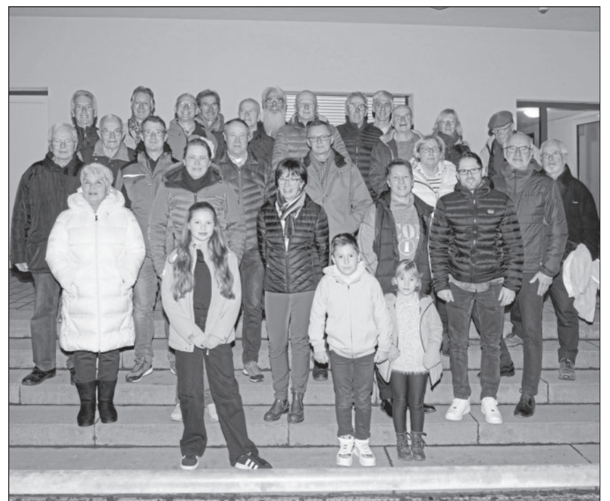
Sportabzeichenverleihung: 37 Sportlerinnen und Sportler aus Winnenden und Umgebung schafften 2025 die Sportabzeichenprüfung.

Die zweite Mannschaft gastiert am Sonntag, 7. Dezember, um 12.15 Uhr beim TV Stetten II. Die erste Mannschaft spielt um 14 Uhr auf dem Kunstrasen in Rommelshausen gegen Kosova Kernen.