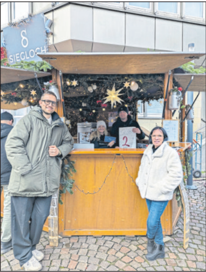
2. Platz: Weingut Siegloch - für einen stimmungsvoll gestalteten Stand.