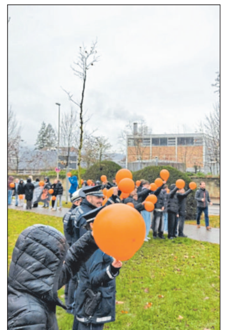
Orangene Ballons reihen sich aneinander - Im Zentrum: Die rote Bank im Stadtgarten

Das Angebot der Vereinsmitglieder richtet sich an gewaltausübende Menschen. Ziel ist, erneute Gewaltausübungen zu verhindern, um so geschädigte Personen zu schützen sowie häusliche Gewalt und Stalking präventiv zu bekämpfen. www.bag-taeterarbeit.de