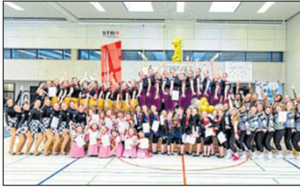
Gruppenbild SF Höfen-Baach (alle 7 Mannschaften).

fen-Baach mit 27,25 Punkten und belegten damit Platz 1.