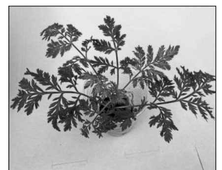
Ein Sämling von A-3.