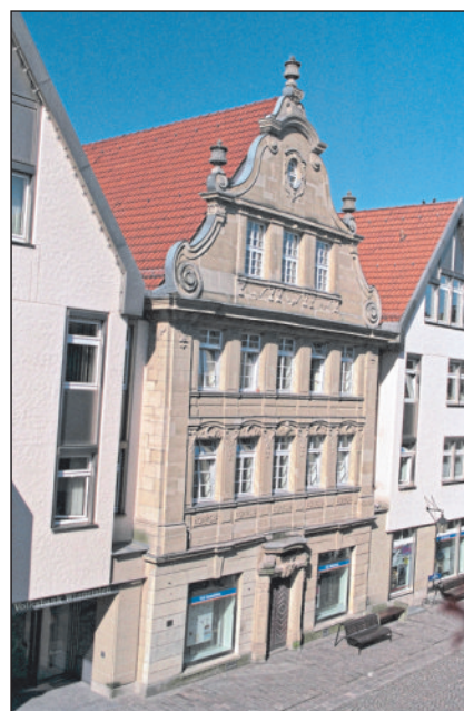
Das sogenannte Storchenhaus in der Marktstraße 24, aufgenommen um 2000. Dieses Gebäude mit Barockfassade ließ Johannes Hauber, Handelsmann in Winnenden und zeitweise auch Bürgermeister, in den 1730er-Jahren errichten.