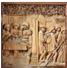
Bild 4: Beim Richter der Stadt klagen die Eltern den Wirt an. Der Richter glaubt ihnen nicht. „Eurer Sohn ist so tot wie dieses Hähnchen am Grill!“ In diesem Augenblick wird das Hähnchen wieder lebendig, bekommt wieder Federn und fliegt davon. Der Sohn kommt frei; der Wirt hängt statt seiner.

Bild 3: Die Eltern eilen zum Grab des Heiligen Jakobus und bitten um Hilfe. Als sie nach 36 Tagen zurückkommen, hängt der Sohn immer noch lebend am Galgen. Der Heilige ist gekommen und hat ihn an den Füßen gestützt.