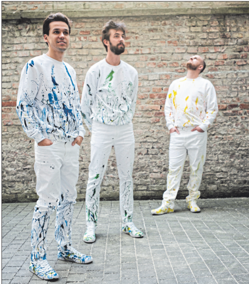
Abwechslungsreiches Schlosskonzert mit dem New Piano Trio.