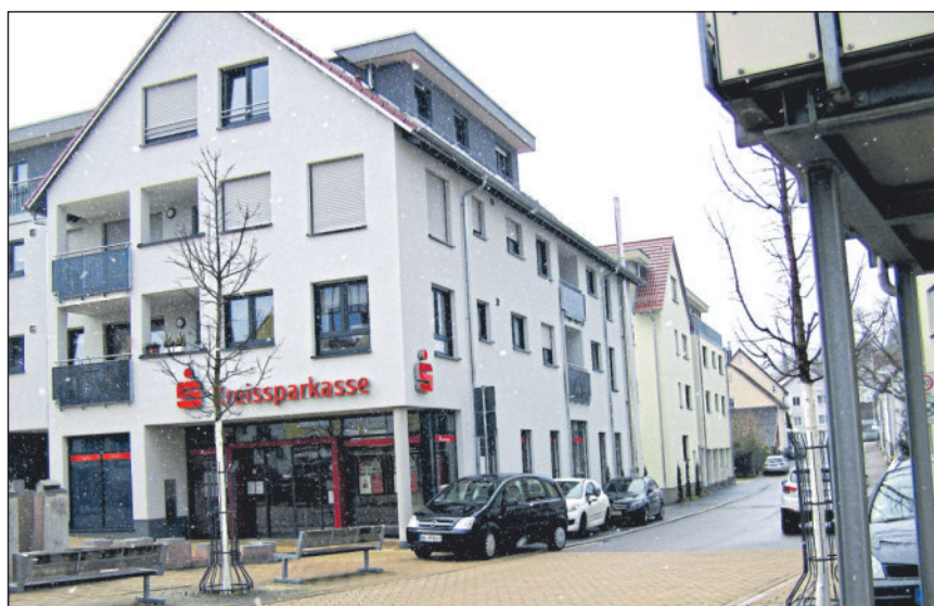
Die Sparkassenfiliale nach dem Umzug in die Querstraße 3.

Die Ausstellung ist auf der Website www.virtuelles-stadtmuseum-winnenden.de zu sehen. Sie befindet sich im Themenraum „Die Stadtteile“ unter Birkmannsweiler. Wenn Sie Fragen haben oder Unterlagen zur Geschichte Winnendens und seiner Teilorte abgeben möchten, dann wenden Sie sich gerne an das Archiv unter Telefon 07195/13-46100 oder per E-Mail an stadtarchiv@winnenden.de .