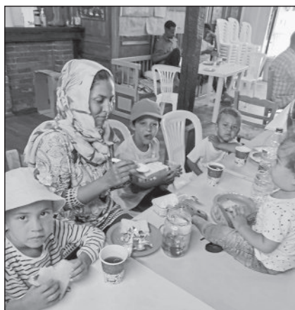
Unser Partnerverein Syniparxi beim Frühstückmachen mit Flüchtlingskindern.

Hierin wird auch ausdrücklich die Praxis der Zurückweisungen von Flüchtlingen auf dem offenen Meer beschrieben (verbotene Pushback's). Für Touristen sichtbar ist dies an den verstärkten Seekontrollen mit Patrouillenbooten. Wenn vor Jahren ab und zu mal eines im Hafen von Mytilini ankerte, so sind heute 5 Boote unterschiedlicher Nationalität dort fest stationiert.