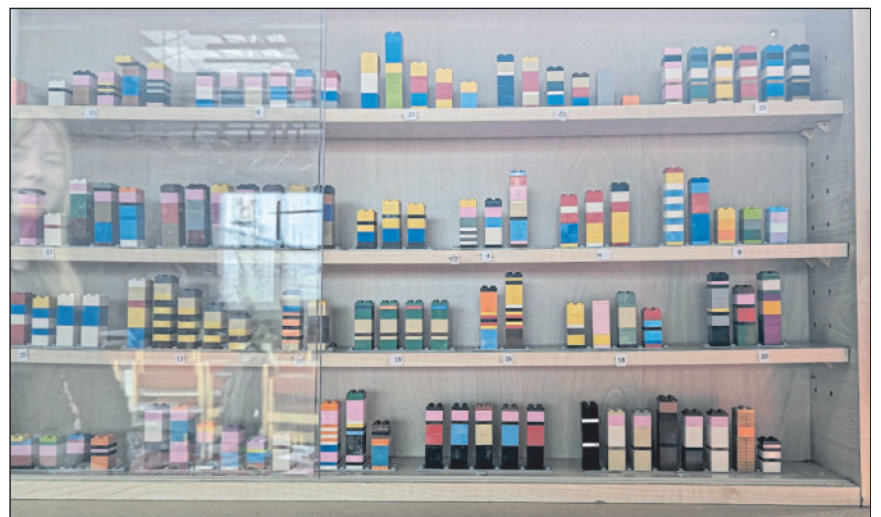
Figurenrätsel aus LEGO-Steinen.