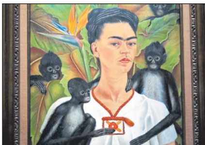
Frida Kahlo: Selbstporträt mit Affen