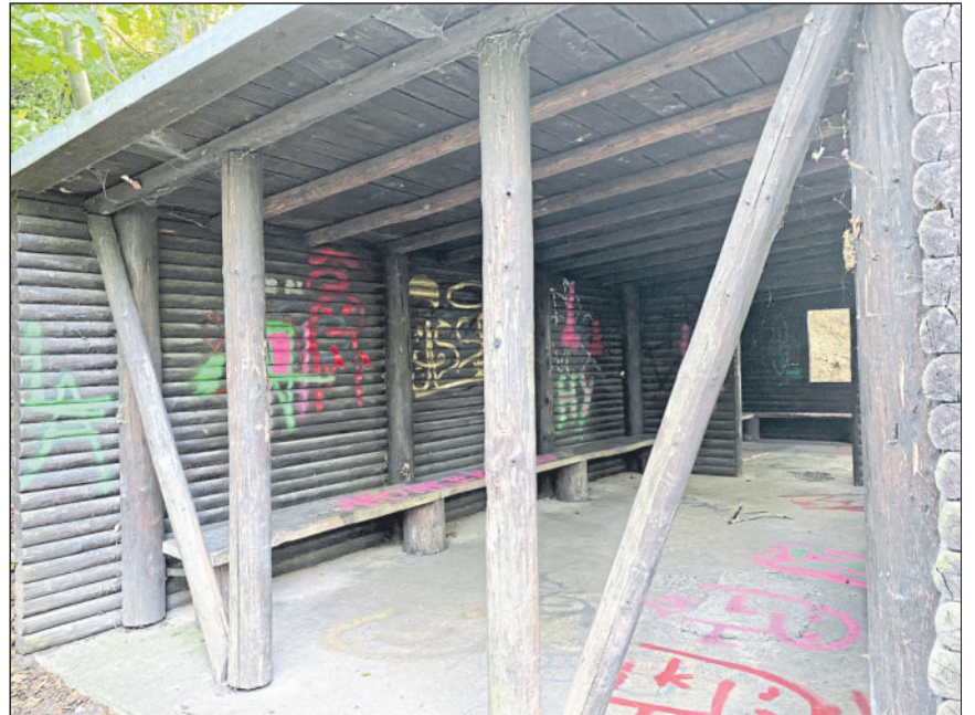
Großflächige Graffitis an der Schutzhütte.