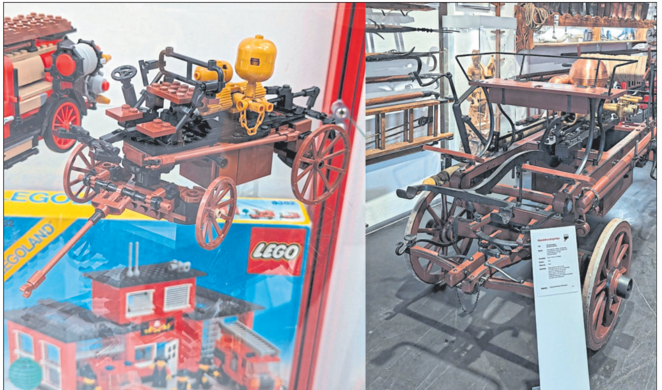
Rechts eine Handdruckspritze aus dem Jahr 1846, links der LEGO-Nachbau.