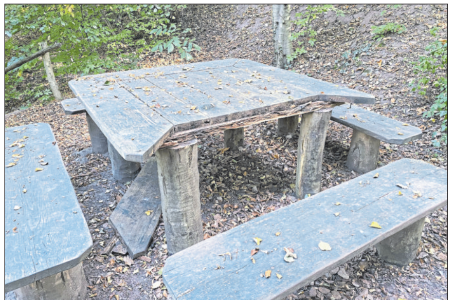
Aus der Tischplatte wurde mit roher Gewalt ein Stück herausgebrochen.

Wegen der Sachbeschädigung wird bei der Polizei eine Anzeige gestellt. Sachdienliche Hinweise bitten wir dem Polizeirevier mitzuteilen (☎ 07195 / 6940).