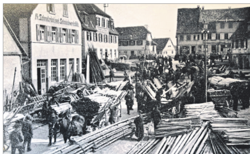
Holzmarkt - dieses Foto ist 1 von ca. 80 Winnender Stadtmotiven.

gen von „Alt-Winnendern“. Auch ein erster Kurzbesuch bei der momen- tanen Hitzewelle vermittelt einen ersten Eindruck, dazu die fast abenteu- erliche Geschichte der analogen Foto- grafie mit Gasplatte und Film. Samstag, den 1. Juli, von 11.00 - 16.00 Uhr geöffnet, Eintritt frei. Im Winnen- der Rathaus, separater Eingang. Wir freuen uns auf Ihren Besuch, Ihr Galerie-Team.