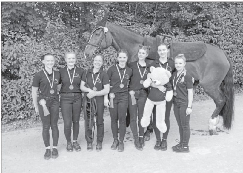
2. Platz für das Juniorteam in Zaisenhausen.