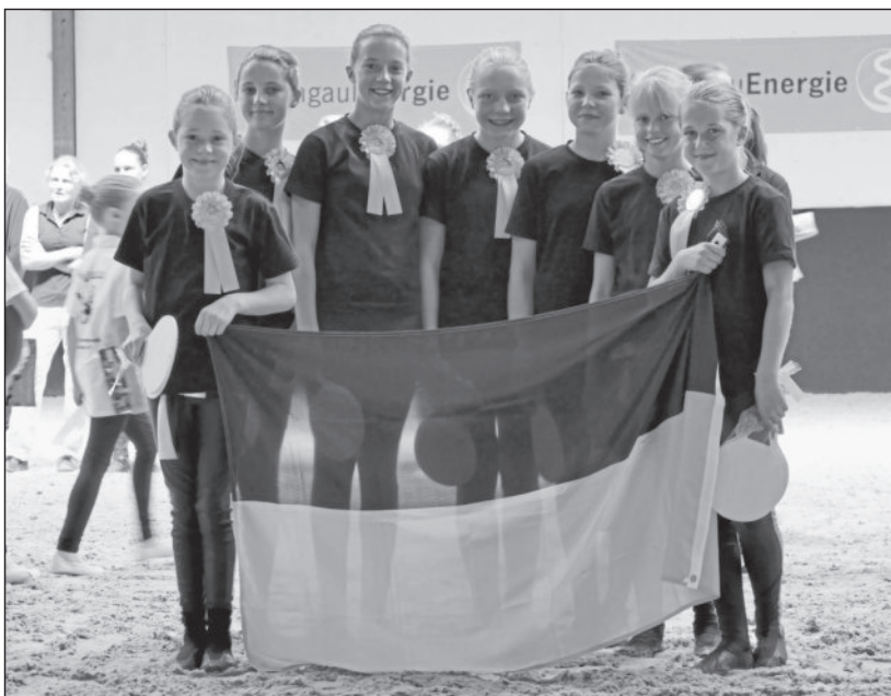
Nachwuchs-Voltigierer unseres Team 3.