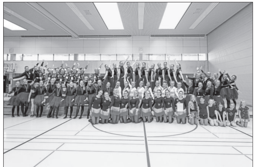
Strahlende Sportlerinnen und Sportler bei strahlendem Sonnenschein!

Am Samstag, den 24. Juni 2023, fanden die Württembergischen Meisterschaften im Turngruppenwettbewerb (TGM/TGW) in Winnenden statt. Ca. 180 Sportlerinnen und Sportler erfüllten die Alfred-Kärcher-Halle mit Tanz, Rhythmischer Sportgymnastik, Turnen und a cappella Gesang . Dieser Mehrkampf war bunt, mitreißend und abwechslungsreich!