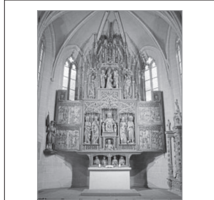
Die Schloßkirche St. Jakobus ist am Sonntag, 2. Juli von 14.00 bis 16.00 Uhr zu Besichtigung und Stille geöffnet