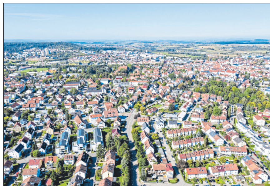
Luftbild 2021: Benjamin Beytekin

am 27. November 2023 um 19:30 Uhr in der Hermann-Schwab-Halle in Winnenden