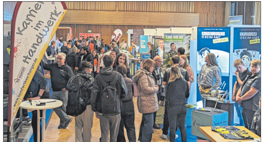
Regel Austausch an den Ständen in der Hermann-Schwab-Halle.