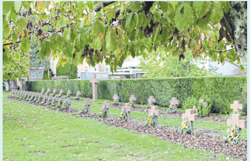
Auch auf dem Stadtfriedhof findet am kommenden Sonntag eine Friedens-Gedenkfeier statt.