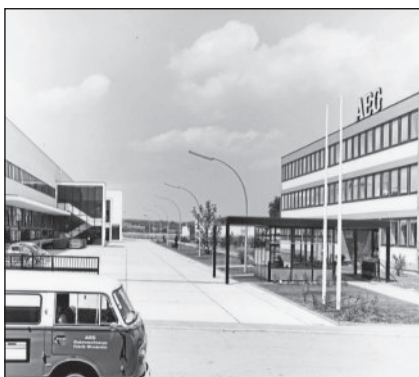
1963 wurde das Werk der AEG Elektrowerkzeuge in Winnenden eingeweiht.

Anmeldung zu allen Veranstaltungen bitte unter diethardfohr50@aol.com oder 07195 64322.