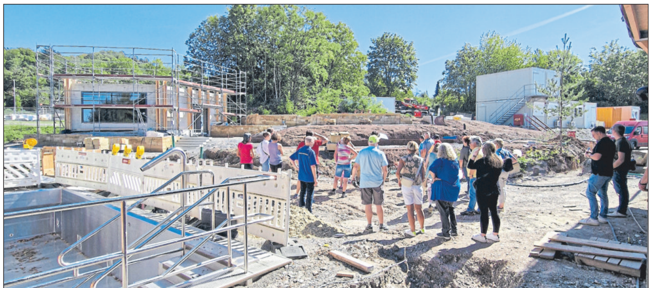
Bei der Führung wurde auch ein Einblick in die entstehende Saunalandschaft geboten.

Die Besucher hatten die Gelegenheit, Einblicke in die Planung und Umsetzung eines Projekts dieser Größenordnung zu bekommen. Die Vorfreude auf die Eröffnung war spürbar und die Besucherinnen und Besucher verließen die Baustelle mit einem Hauch von Begeisterung und Erstaunen.