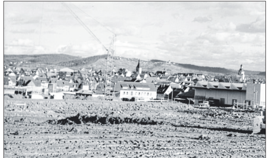
Das Industriegebiet während der Bauarbeiten der Firma AEG um 1962.