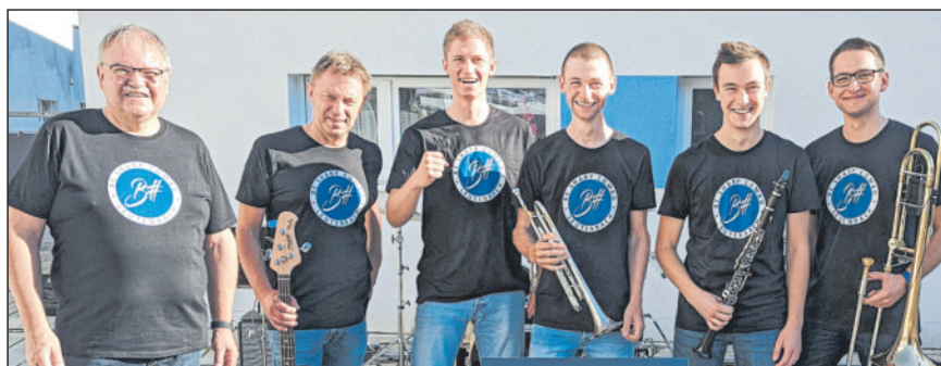
be sharp combo.