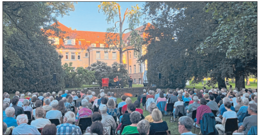
Über 300 Zuhörende lauschten gespannt den Vorleserinnen des Abends.