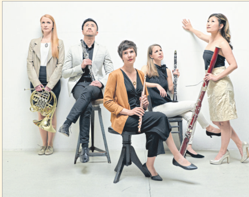
Zu Gast in der Reihe Schlosskonzerte: das ARUNDOS Quintett.

Das Theaterprogramm bietet aufregend Neues. Georg Büchners „Woyzeck“ zeigt sich nur vordergründig als „klassisches Theaterrepertoire“. Die Konzeption der badischen Landesbühne überrascht mit Songs von Tom Waits und einer neuen Textfassung. Klassisch komödiantisch geht's im „Tatortreiniger“ der Komödie Düsseldorf zu, während die beiden Produktionen der Ensembles Filmtheater und a.gon München den Bühnenraum faszinierend neu deuten. In „Glückskinder“ ist der Ensemblename Programm: spezialisiert auf nostalgische Filmstoffe bringen die Schauspieler erstmalig einen Schwarzweiß-Film auf die Theaterbühne - und behalten dabei die Schwarzweißästhetik bei. Großformatige Kohlezeichnungen entstehen live auf der Bühne in „Ein Kuss - Antoine Ligabue“, einer Bühnenerzählung vom Leben des verspotteten